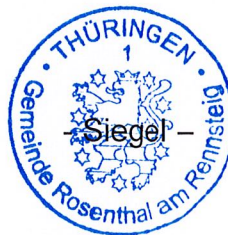
A. Neumüller Bürgermeister Gemeinde Rosenthal am Rennsteig