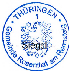
A. Neumüller Bürgermeister Gemeinde Rosenthal am Rennsteig