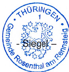
A. Neumüller Bürgermeister Gemeinde Rosenthal am Rennsteig