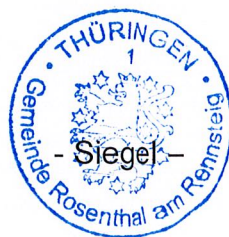
A. Neumüller Bürgermeister Gemeinde Rosenthal am Rennsteig