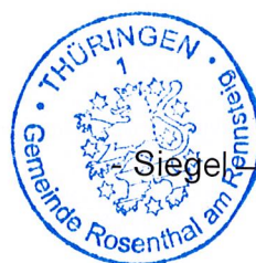
Neumüller Bürgermeister Gemeinde Rosenthal am Rennsteig