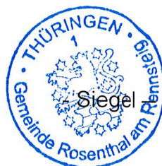
Neumüller Bürgermeister Gemeinde Rosenthal am Rennsteig