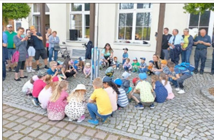
Eindrücke aus dem Kindergarten „Kuckucksnest“ im OT Blankenstein